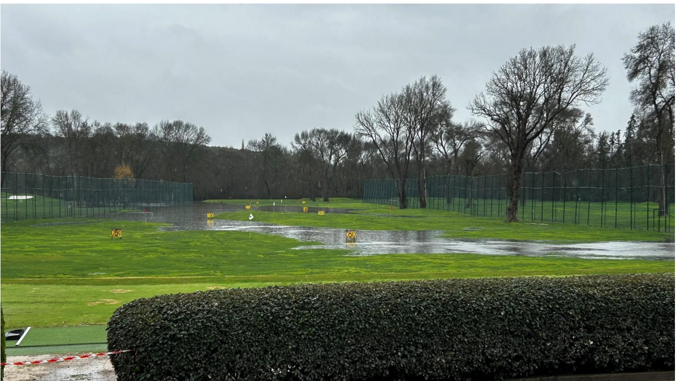
Fotografía de las 11:00hrs 18 de marzo

Esto se traduce en un aumento inmediato de agua en la zona de campo de prácticas y zonas aledañas