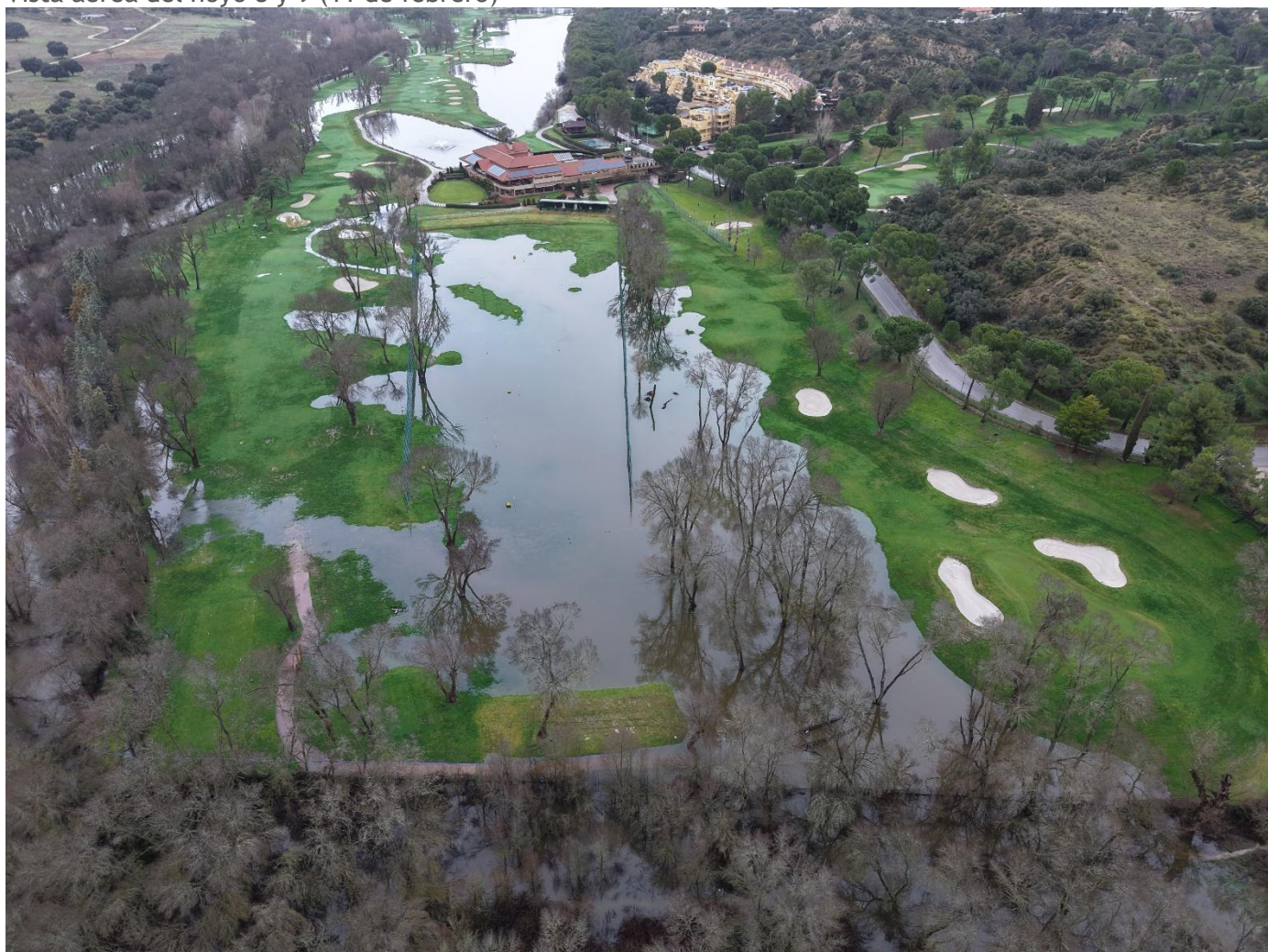
Vista aérea del hoyo 8 y 9 (11 de febrero)

Les mostramos unas fotografías del estado actual del campo: